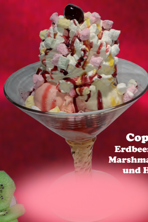
326 Coppa Sun gem. Milch- u. Fruchteis, Obstsalat, Passoalikör, Honigmelone & Sahne 9,70 € 521 Coppa Marshmallow 1 Erdbeer-, Vanille- und Kokoseis, Marshmallows, Erdbeer-, Tropical- und Heidelbeersoße & Sahne 8,50 €