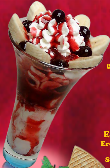
48 KiBa - Becher gem. Eis, Amarenakirschen, Bananen, Sahne & Soße 8,50 €