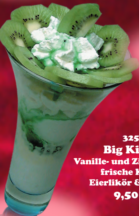
63 Kiwieisbecher Vanille- und Zitroneneis, frische Kiwi & Sahne 8,50 € 325 Big Kiwi 1 Vanille- und Zitroneneis, frische Kiwi, Eierlikör & Sahne 9,50 €