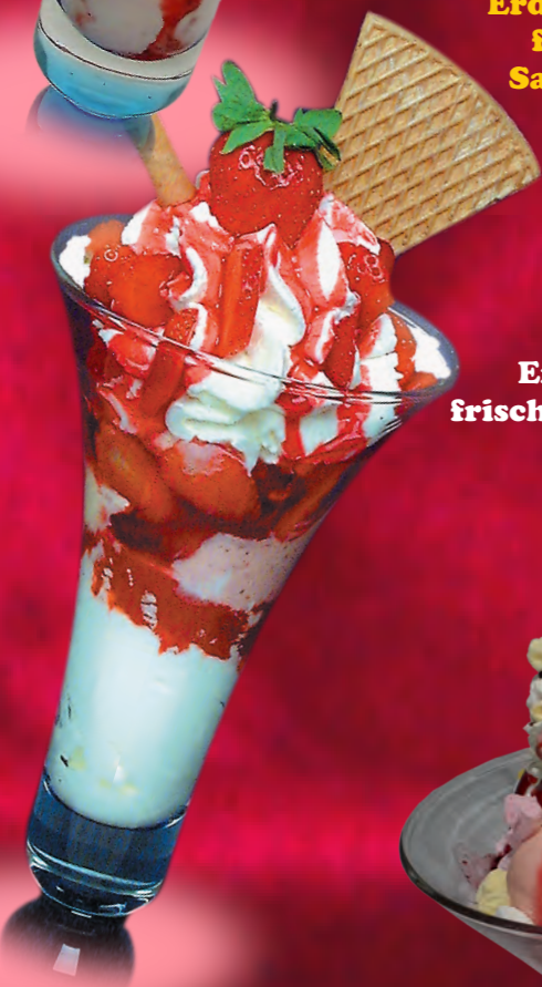
52 Erdbeereisbecher Erdbeer- und Vanilleeis, frische Erdbeeren, Sahne & Erdbeersoße 8,50 € 520 Big Erdbeer 1 Erdbeer- und Vanilleeis, frische Erdbeeren, Erdbeersoße, Sahne & Eierlikör 9,50 €